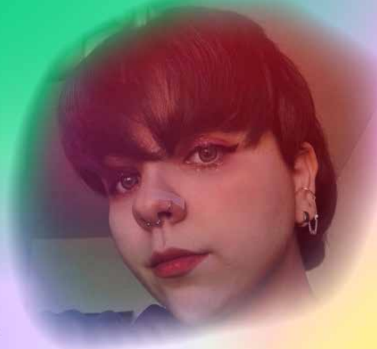
River (they / them)

It’s the most beautiful kind of freedom.”